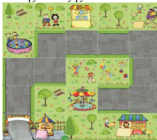
Εικόνα 1. Δάπεδο πολλαπλασιασμού «Μια μέρα στο Λούνα παρκ».

Το ενδεικτικό σενάριο με αντικείμενο τη διδασκαλία του πολλαπλασιασμού με τη χρήση του προγραμματιζόμενου ρομπότ δαπέδου Bee-Bot, σχεδιάστηκε έτσι ώστε να προσελκύει το ενδιαφέρον αλλά και να είναι κατάλληλο για το νοητικό επίπεδο της συγκεκριμένης ηλικιακής ομάδας στην οποία απευθύνεται. Οι δραστηριότητες συγκροτήθηκαν έπειτα από βιβλιογραφική επισκόπηση σχετικά με τη διδασκαλία του πολλαπλασιασμού στο Δημοτικό Σχολείο σε συνδυασμό και με τη χρήση της Εκπαιδευτικής Ρομποτικής. Για τη δημιουργία και τον σχεδιασμό του δαπέδου, οι εικόνες που χρησιμοποιήθηκαν, αντλήθηκαν είτε από το Βιβλίο μαθητή των Μαθηματικών της Δ' τάξης είτε από το διαδίκτυο.