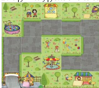
Εικόνα 1. Δάπεδο πολλαπλασιασμού «Μια μέρα στο Λούνα παρκ».

Το ενδεικτικό σενάριο με αντικείμενο τη διδασκαλία του πολλαπλασιασμού με τη χρήση του προγραμματιζόμενου ρομπότ δαπέδου Bee-Bot, σχεδιάστηκε έτσι ώστε να προσελκύει το ενδιαφέρον αλλά και να είναι κατάλληλο για το νοητικό επίπεδο της συγκεκριμένης ηλικιακής ομάδας στην οποία απευθύνεται. Οι δραστηριότητες συγκροτήθηκαν έπειτα από βιβλιογραφική επισκόπηση σχετικά με τη διδασκαλία του πολλαπλασιασμού στο Δημοτικό Σχολείο σε συνδυασμό και με τη χρήση της Εκπαιδευτικής Ρομποτικής. Για τη δημιουργία και τον σχεδιασμό του δαπέδου, οι εικόνες που χρησιμοποιήθηκαν, αντλήθηκαν είτε από το Βιβλίο μαθητή των Μαθηματικών της Δ' τάξης είτε από το διαδίκτυο.