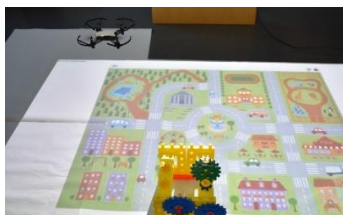
Εικόνα 2. Το Drone Tello πετά πάνω από το περιβάλλον.

Το πλάνο χωρίζεται σε 10 δραστηριότητες. Στις 6 πρώτες το ρομπότ παρακινούμενο από τον αφηγητή ταξιδεύει σε διαφορετικούς προορισμούς μέσα στην πόλη. Σε αυτές τις δραστηριότητες έχουμε εξοικείωση με το σχετικό με κατευθύνσεις λεξιλόγιο (turn, right, left, forward, backwards). Στις 4 τελευταίες, το ρομπότ φτάνει στο γκαράζ και μετατρέπεται σε drone, οπότε προχωράμε στην εκμάθηση κατευθύνσεων στον 3d χώρο, προγραμματίζοντας μέσω Scratch 2.0 το drone Tello να εκτελέσει διαδικασίες απογείωσης-προσγείωσης, πτήσης στην ευθεία, όπως στην Εικόνα 2, και έτοιμους ελιγμούς όπως «flip». Το λεξιλόγιο που καλύπτεται εδώ συμπεριλαμβάνει εκφράσεις σχετικές με την πτήση (fly/ up, down, land, take off).