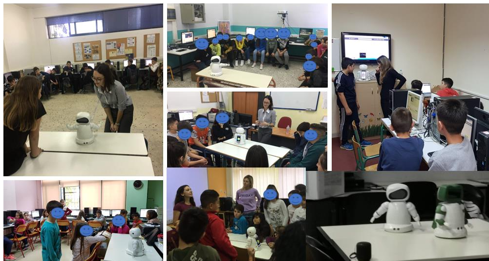
Σχήμα 2: Φωτογραφίες από διαφορετικές σχολικές αίθουσες κατά την διδασκαλία με τη χρήση του ρομποτικού βοηθού STIMEY

Το μάθημα διεξήχθη από τον/την εκπαιδευτικό σε συνεργασία με το ρομπότ. Το ρομπότ έδινε πληροφορίες σχετικά με το θέμα και προέτρεπε τους μαθητές να χρησιμοποιούν τα μέσα κοινωνικής δικτύωσης που υπάρχουν στην πλατφόρμα STIMEY. Σκοπός ήταν να μοιραστούν μεταξύ τους τις απόψεις τους σχετικά με το θέμα της διδασκαλίας. Έπειτα, έκανε ερωτήσεις στους μαθητές μέσω ενός κοιζ γνώσεων και ανταποκρινόταν στις απαντήσεις τους. Οι μαθητές δούλεψαν ατομικά με έναν υπολογιστή ή tablet ο καθένας. Αντάλλαξαν πληροφορίες μέσω αυτών με τους συμμαθητές, το ρομπότ και τον εκπαιδευτικό τους. Στο τέλος της διαδικασίας, οι μαθητές απάντησαν το ερωτηματολόγιο σχετικά με τις στάσεις τους απέναντι στο ρομπότ και τις επιστήμες STEM. Στο σχήμα 2, παρατίθενται φωτογραφίες από διαφορετικές τάξεις στις οποίες πραγματοποιήθηκε η παρέμβαση με τον ρομποτικό βοηθό.