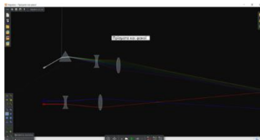
Εικόνα 3. Η προσομοίωση στο Algodoo «Πρίσματα και φακοί»

Ο εκπαιδευτικός παρουσιάζει στους μαθητές τα είδη φακών που υπάρχουν και εξηγεί το σχήμα του καθενός καθώς και το γεγονός πως το όνομα τους προκύπτει από τον τρόπο με τον οποίο μεταχειρίζονται το φως που περνάει από μέσα τους. Στη συνέχεια, συνεχίζει με τη διεξαγωγή του πρώτου πειράματος του βιβλίου εργασιών των μαθητών (Αποστολάκης, κ.ά., 2009γ). Οι μαθητές χωρισμένοι σε ομάδες των 4 έως 5 ατόμων πρέπει να κόψουν ένα ορθογώνιο κομμάτι από το χαρτόνι ενός κουτιού από γάλα ή από χυμό και στη συνέχεια να ανοίξουν με το διατηρητικό μία τρύπα στην άκρη του χαρτονιού. Αφού προσθέσουν με το δάχτυλό τους μία σταγόνα νερό στην τρύπα που άνοιξαν, καλούνται να κοιτάξουν μέσα από την τρύπα μία εικόνα ή μία λέξη στο βιβλίο τους. Στη συνέχεια, μπορούν να δοκιμάσουν να κοιτάξουν μέσα από την τρύπα από διαφορετικές αποστάσεις από τα μάτια τους και από το βιβλίο και να καταγράψουν τι παρατηρούν. Στη συνέχεια, οι μαθητές έρχονται σε επαφή με τη προσομοίωση του Algodoo «Πρίσματα και φακοί» (Εικόνα 3) - η οποία έχει δημιουργηθεί από τους συγγραφείς του σεναρίου - αφού αρχικά προτείνουμε στα παιδιά να ομαδοποιήσουν τους συλλογισμούς τους χρησιμοποιώντας λογισμικό comapping.