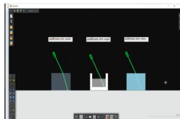
Εικόνα 2. Η προσομοίωση «Διάθλαση του Φωτός» στο Algodoo