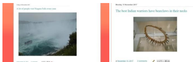
Εικόνα 1 α, β. Αξιοθέατα - Μουσεία

Η θεματολογία αφορούσε τοπικά προϊόντα, μέσα μετακίνησης, ζώα, φύση, μουσεία, αρχιτεκτονική. Σύντομες αλλά ολοκληρωμένες λεζάντες σε ύφος απλό, ανεπίσημο, καθημερινό, απευθύνονταν σε φίλους, συγγενείς ή και ευρύτερο κοινό για πληροφόρηση, έκφανση συναισθημάτων ή εντυπώσεων (Εικόνα 1 α, β). Αν κάποιος κοινοποιούσε παρόμοιες ιδέες, οι μαθητές αναπροσάρμοζαν την πορεία τους.