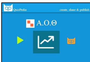
Εικόνα 2. Quizpedia

Ακόμη, στην ιστοσελίδα του κ. Καμαρινού μπορείτε να βρείτε online διαγωνίσματα στα μαθήματα «Αρχές Οργάνωσης και Διοίκησης» και «Βασικές Αρχές Κοινωνικών Επιστημών» καθώς και online σταυρόλεξα.