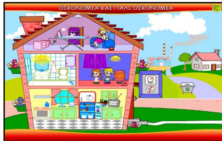
Εικόνα 3. Οικονομία και πάλι Οικονομία