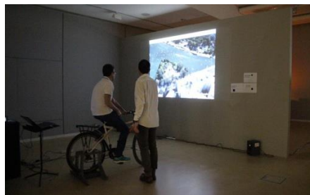
Σχήμα 1. Google Bike

Στο σύστημα έχουν τοποθετηθεί αισθητήρες στον πίσω τροχό (S1) καθώς και στο τιμόνι (S2-S5) για την λήψη πληροφοριών πλοήγησης από τις ενέργειες των χρηστών. Ο αισθητήρας S1 είναι ένας μαγνητικός αισθητήρας (μαγνητική παγίδα) που χρησιμοποιείται συνήθως στους συναγερμούς και αποτελείται από ένα διακόπτη και έναν μαγνήτη. Όσο ο μαγνήτης βρίσκεται κοντά στον διακόπτη, η κατάσταση του διακόπτη είναι ανοιχτή, διαφορετικά είναι κλειστή. Ο διακόπτης τοποθετείται όπως φαίνεται στην εικόνα και ο μαγνήτης τοποθετείται σε μία από τις ακτίνες του τροχού. Κάθε φορά που ο τροχός κάνει μια στροφή, η λογική HIGH στέλνεται στον προγραμματιζόμενο μικροελεγκτή. Οι αισθητήρες S3 και S4 είναι υπεύθυνοι