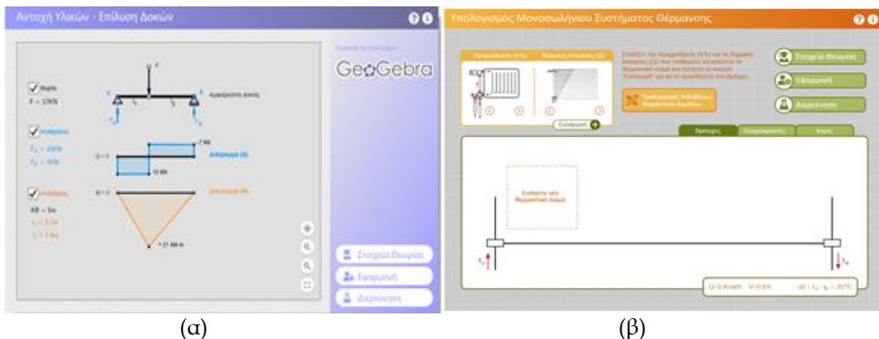
Σχήμα 1. Μαθησιακά Αντικείμενα Μηχανολογίας: (α) Αντοχή Υλικών - Επίλυση δοκών (β) Υπολογισμός Μονοσωλήνιου Συστήματος Θέρμανσης

Αυτό αποτελεί πρακτική ανάγκη για τον τεχνητή θέρμανσης και απαιτεί χρονοβόρους και σύνθετους υπολογισμούς για την παρατήρηση μιας μικρής αλλαγής στην προρύθμιση. Η πρόσθετη παιδαγωγική αξία του ΜΑ προκύπτει από το γεγονός ότι ο μαθητής προσθέτει σώματα και μεταβάλλει τις θερμίδες και την προρύθμιση παρατηρώντας τις αλλαγές που επέρχονται στο βρόγχο του συστήματος θέρμανσης. Πιο αναλυτικά, ο χρήστης έχει τη δυνατότητα αφενός να κατασκευάσει έναν βρόγχο μονοσωλήνιου συστήματος θέρμανσης, αποτελούμενο από μια σειρά πραγματικών θερμαντικών σωμάτων που καλύπτουν χώρους με θερμικές ανάγκες της επιλογής του, και αφετέρου να καθορίσει την προρύθμιση του νερού προσαγωγής κάθε σώματος ξεχωριστά. Το ΜΑ αντιδρά δυναμικά στις επιλογές του χρήστη, τόσο σε επίπεδο γραφικών αναπαραστάσεων όσο και σε επίπεδο παρουσίασης αποτελεσμάτων που αφορούν στα λειτουργικά χαρακτηριστικά του συστήματος θέρμανσης. Συγκεκριμένα, παρουσιάζονται οι υπολογισμοί θερμοκρασιών κάποιων χαρακτηριστικών σημείων του κυκλώματος, καθώς και οι υπολογισμοί των θερμικών αποδόσεων των σωμάτων και των συντελεστών διόρθωσης. Τέλος, ο χρήστης μπορεί να ολοκληρώσει τη διαδικασία υπολογισμού, επιλέγοντας από τον πίνακα προδιαγραφών χαλύβδινων θερμαντικών σωμάτων, τα κατάλληλα θερμαντικά σώματα για τους χώρους του κυκλώματος που έχει κατασκευάσει, σε ένα αυθεντικό πλαίσιο.