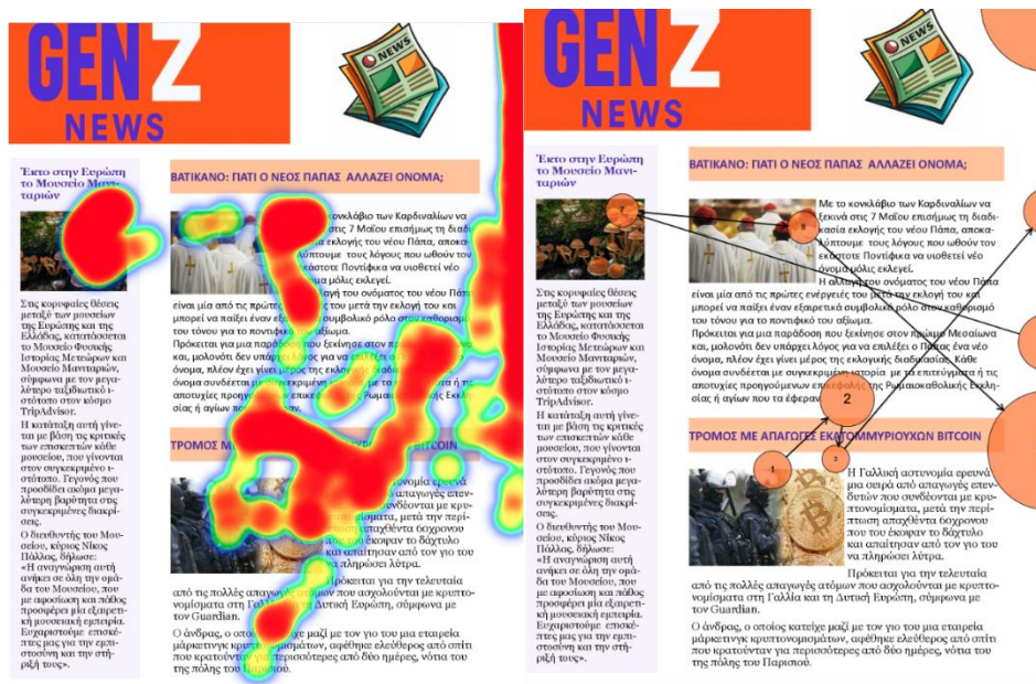
Εικόνα 2: Απεικόνιση της οπτικής προσοχής των συμμετεχόντων κατά την προβολή των τριών ειδήσεων. (α) Χρωματικός χάρτης (heatmap) που παρουσιάζει την ένταση και τη διάρκεια της εστίασης (αριστερά), (β) Χαρτογράφηση οπτικής διαδρομής (scanpath) που καταγράφει τη σειρά και τα σημεία εστίασης του βλέμματος (δεξιά).

Στο σύνολο των συμμετεχόντων, η θετική και ουδέτερη είδηση προσέλκυσαν λιγότερη προσοχή, ενώ η αρνητική είδηση τράβηξε πρώτη το ενδιαφέρον των συμμετεχόντων, όπως φαίνεται στο χρωματικό χάρτη (heatmap) και στην οπτική διαδρομή (scanpath) (Εικόνα 2).