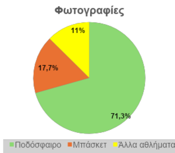
Διάγραμμα 2: Ο αριθμός φωτογραφιών στο σύνολο των πρωτοσέλιδων που εξετάστηκαν

Συγκεκριμένα, η «SportDAY» φιλοξένησε στο πρωτοσέλιδό της τα περισσότερα θέματα (n=3.957, 22,8%) και τις λιγότερες φωτογραφίες (n=872, 8,8%), σε αντίθεση με το μεγάλο σχήματος «ΦΩΣ» που έδωσε ιδιαίτερη σημασία στις φωτογραφικές αναπαραστάσεις (n=2.482, 25,2%) και τον «Πρωταθλητή» που δημοσίευσε τα λιγότερα θέματα (n=2.410, 14%). Ειδικότερα, η «SportDAY» αναδείχθηκε ως η πλέον ενεργή εφημερίδα στην κάλυψη του ποδοσφαίρου (n=2.793) και του μπάσκετ (n=922) σε επίπεδο θεματολογίας. Παράλληλα, δημοσίευσε τις λιγότερες φωτογραφίες ποδοσφαίρου (n=632) σε σύγκριση με τη