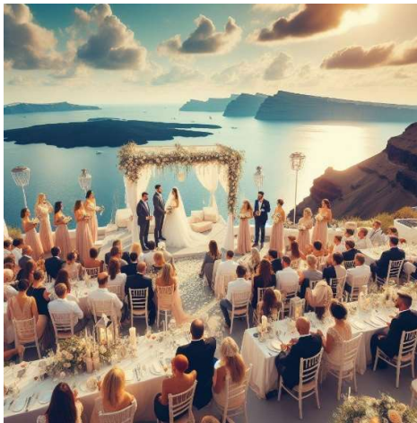
Εικόνα 2. Ιστοσελίδα: gazetta.gr | Τίτλος: Ψηφίστηκε το νομοσχέδιο: Η Ελλάδα έγινε η πρώτη ορθόδοξη χώρα που νομιμοποίησε τον γάμο των ομόφυλων ζευγαριων | Πρόγραμμα: Microsoft Copilot

Στο πρόγραμμα Craiyon AI, οι φωτογραφίες έχουν μικρή ανάλυση και δεν παρουσιάζουν συνάφεια με τον τίτλο των άρθρων. Οι φωτογραφίες δείχνουν ηλικιωμένους, μόνες γυναίκες, παπάδες και ετερόφυλα ζευγάρια (Εικόνα 3). Επειδή οι εικόνες που παρήγαγε δεν είχαν καμία συνάφεια με τον τίτλο, δοκιμάστηκε και η λέξη-κλειδί “ομόφυλα ζευγάρια”, αλλά και πάλι δεν εμφανίστηκαν συναφή αποτελέσματα. Το DeepAI δεν εμφάνισε συναφή αποτελέσματα για κανέναν τίτλο. Στον τίτλο “Με 175 «ναι» πέρασε τελικά το νομοσχέδιο για τον γάμο των ομόφυλων ζευγαριών” από την ιστοσελίδα newsbeast.gr, η εικόνα δεν είχε καμία συνάφεια. Το Wombo Dream, από τους οκτώ τίτλους, δημιούργησε