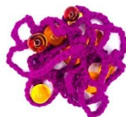
Εικόνα 4. Τρισδιάστατο μοντέλο διασυνδεδεμένων μακρομορίων με μόρια νερού