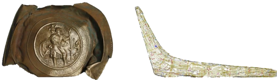
Εικόνα 1. Μεταλλικός δίσκος και ξύλινο στέλεχος πρύμνης πλοίου

Με αφορμή τα ευρήματα ενός ναυαγίου που ανασύρθηκε στην ακτή Belihno της Πορτογαλίας, οι μαθητές/τριες ακολουθούν διαδρομές και ταξίδια ανθρώπων, αντικειμένων και ιδεών. Η προσέγγιση ξεκινά με παρατήρηση των αντικειμένων που βρέθηκαν στο ναυάγιο, τα οποία είναι ένας μεταλλικός δίσκος και ένα ξύλινο στέλεχος πρύμνης πλοίου, όπως φαίνονται στην Εικόνα 1.