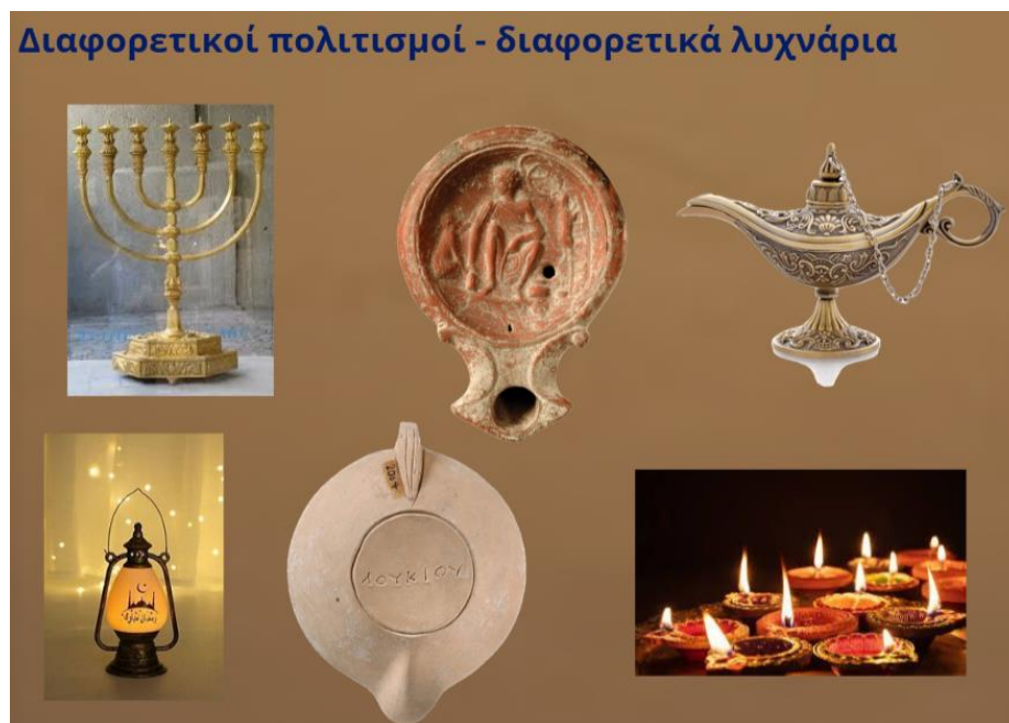
Εικόνα 6. Απόσπασμα από δημιουργία μαθητών/τριών - Λυχνάρια διαφορετικών πολιτισμών

Στόχος της προσέγγισης είναι οι μαθητές/τριες να εμπλακούν σε διαδικασίες επιστημονικής έρευνας (παρατήρηση, διατύπωση ερωτημάτων και υποθέσεων, ερμηνεία) και δημιουργικής έκφρασης, συνοικοδομώντας τη γνώση. Από την ανάλυση των αποτελεσμάτων των αρχαιομετρικών μεθόδων, προκύπτει ότι στον πάτο του λυχναριού υπάρχει μία ξένη ουσία, η οποία ταυτοποιείται ως λάδι. Ταυτόχρονα, αναγνωρίζονται τα υλικά κατασκευής του ίδιου του λυχναριού. Με αυτά τα δεδομένα, οι μαθητές/τριες καλούνται στη συνέχεια να συνδέσουν την υλικότητα του αντικείμενου με το ιστορικό πλαίσιο και τα διαφορετικά πεδία της ζωής (π.χ. οικονομία, καθημερινή ζωή, ιδεολογία, θρησκεία, λατρεία, τέχνη), να συνομιλήσουν με το αντικείμενο, αποκρυπτογραφώντας τις διαφορετικές διαστάσεις – λειτουργίες του και να συνδιαμορφώσουν τις δικές τους ιστορίες (ποικίλα κειμενικά είδη π.χ. γραπτά κείμενα, ψηφιακές αφηγήσεις, εικαστικές δημιουργίες). Ταξιδεύοντας πίσω στον χρόνο, αφηγούνται ιστορίες για την πιθανή χρήση του λυχναριού, συζητούν για την κοινωνική τάξη των τεχνιτών στην πρώιμη βυζαντινή περίοδο και στο εμπορικό κέντρο της Θεσσαλονίκης. Μελετούν τη χρήση του λυχναριού σε άλλους πολιτισμούς και εντοπίζουν τα κοινά στοιχεία (δοξασίες, μύθοι) μέσω πολιτισμικών αλληλεπιδράσεων. Υποδύονται ρόλους, όπως φαίνεται στην Εικόνα 6, σχεδιάζουν μοτίβα και συσχετίζουν το λυχνάρι με αντικείμενα που χρησιμοποιούμε σήμερα.