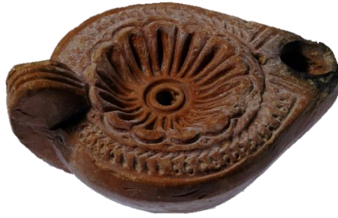
Εικόνα 5. Πήλινο Λυχνάρι Μουσείου Βυζαντινού Πολιτισμού Θεσσαλονίκης

Στόχος της προσέγγισης είναι οι μαθητές/τριες να εμπλακούν σε διαδικασίες επιστημονικής έρευνας (παρατήρηση, διατύπωση ερωτημάτων και υποθέσεων, ερμηνεία) και δημιουργικής έκφρασης, συνοικοδομώντας τη γνώση. Από την ανάλυση των αποτελεσμάτων των αρχαιομετρικών μεθόδων, προκύπτει ότι στον πάτο του λυχναριού υπάρχει μία ξένη ουσία, η οποία ταυτοποιείται ως λάδι. Ταυτόχρονα, αναγνωρίζονται τα υλικά κατασκευής του ίδιου του λυχναριού. Με αυτά τα δεδομένα, οι μαθητές/τριες καλούνται στη συνέχεια να συνδέσουν την υλικότητα του αντικείμενου με το ιστορικό πλαίσιο και τα διαφορετικά πεδία της ζωής (π.χ. οικονομία, καθημερινή ζωή, ιδεολογία, θρησκεία, λατρεία, τέχνη), να συνομιλήσουν με το αντικείμενο, αποκρυπτογραφώντας τις διαφορετικές διαστάσεις – λειτουργίες του και να συνδιαμορφώσουν τις δικές τους ιστορίες (ποικίλα κειμενικά είδη π.χ. γραπτά κείμενα, ψηφιακές αφηγήσεις, εικαστικές δημιουργίες). Ταξιδεύοντας πίσω στον χρόνο, αφηγούνται ιστορίες για την πιθανή χρήση του λυχναριού, συζητούν για την κοινωνική τάξη των τεχνιτών στην πρώιμη βυζαντινή περίοδο και στο εμπορικό κέντρο της Θεσσαλονίκης. Μελετούν τη χρήση του λυχναριού σε άλλους πολιτισμούς και εντοπίζουν τα κοινά στοιχεία (δοξασίες, μύθοι) μέσω πολιτισμικών αλληλεπιδράσεων. Υποδύονται ρόλους, όπως φαίνεται στην Εικόνα 6, σχεδιάζουν μοτίβα και συσχετίζουν το λυχνάρι με αντικείμενα που χρησιμοποιούμε σήμερα.