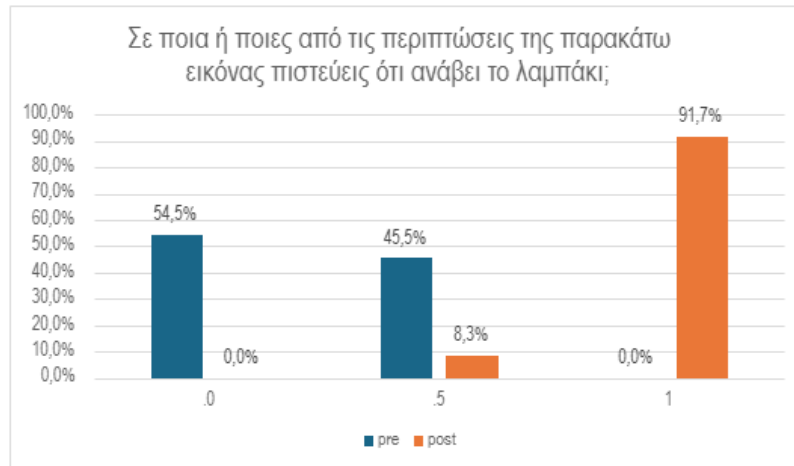
Σχήμα 2. Ποσοστιαία κατανομή με βάση τις απαντήσεις πριν και μετά την εκπαιδευτική παρέμβαση στην αναγνώριση λειτουργικής σύνδεσης απλού ηλεκτρικού κυκλώματος