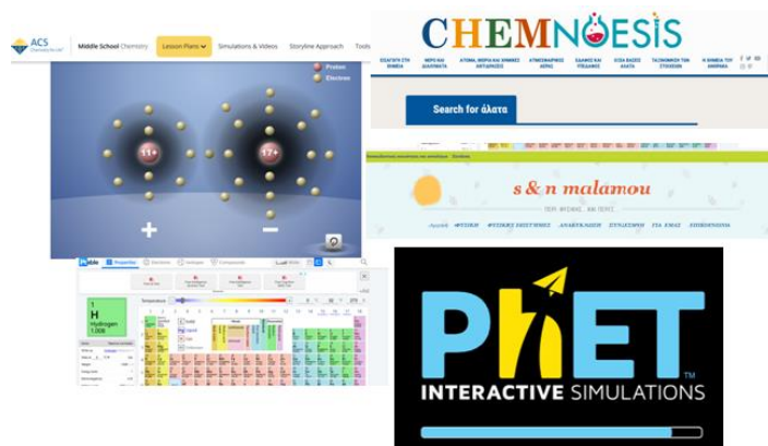
Εικόνα 1. Ψηφιακά εργαλεία 1

Στην 5 η και 6 η δραστηριότητα ζητείται από τους μαθητές να παρακολουθήσουν στο διαδικτυο δύο διαφορετικά βίντεο για το ίδιο χημικό στοιχείο, ένα εκ των οποίων περιέχει ψευδή στοιχεία και χρησιμοποιεί την επιστήμη για να προκαλέσει μεγάλη τηλεθέαση με σκοπό το κέρδος, καθώς επίσης και τους ζητείται και η επίσκεψη σε δύο διαφορετικές ομάδες σε μέσο κοινωνικής δικτύωσης, η μια εκ των οποίων ενός έγκυρου επιστημονικού οργανισμού και η άλλη με αμφίβολο σκοπό και περιεχόμενο (Εικόνα 2).