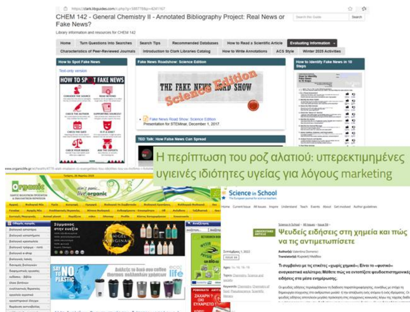
Εικόνα 3. Ψηφιακά εργαλεία 3

Το φύλλο εργασίας, το οποίο παρατίθεται στο Παράρτημα, έχει σχεδιαστεί ώστε να επιτυγχάνονται οι αρχικοί στόχοι της παρούσας εργασίας. Η επιλογή των ιστοτόπων και των ψηφιακών εργαλείων έγινε με βασικό κριτήριο την εγκυρότητα, την επιστημονικότητα και την αναγνώρισή τους από τη διεθνή εκπαιδευτική κοινότητα. Ένας επιπλέον, βασικός παράγοντας, είναι η δωρεάν διάθεση των ψηφιακών εργαλείων από τους δημιουργούς, ώστε οι μαθητές να έχουν ίσες ευκαιρίες στη γνώση. Τέλος η αξιοπιστία των εργαλείων, η συνεχής επικαιροποίηση των γνώσεων και των πληροφοριών, η προσπέλασή τους και η σύνδεση με το εκπαιδευτικό περιεχόμενο και το αναλυτικό πρόγραμμα σπουδών αποτέλεσαν επιπλέον παράγοντες να την επιλογή τους μεταξύ μιας μεγάλης πληθώρας ψηφιακών εργαλείων. Οι υπερσύνδεσμοι των ιστοτόπων και των ψηφιακών εργαλείων (τελευταία προσπέλαση 24/06/2025) που χρησιμοποιήθηκαν είναι: