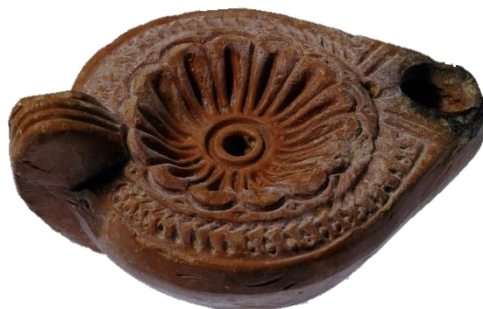
Εικόνα 5. Πήλινο Λυχνάρι Μουσείου Βυζαντινού Πολιτισμού Θεσσαλονίκης

Στην τρίτη προσέγγιση, οι μαθητές/τριες μελετούν ένα πήλινο λυχνάρι της πρώιμης βυζαντινής περιόδου, όπως φαίνεται στην Εικόνα 5, το οποίο βρίσκεται στο Μουσείο Βυζαντινού Πολιτισμού Θεσσαλονίκης.