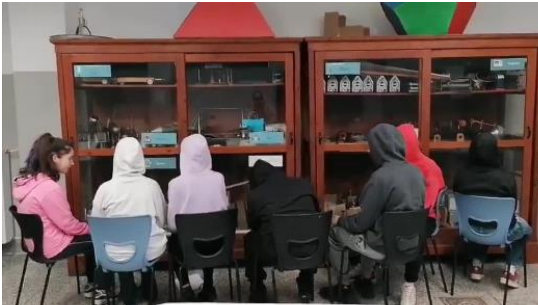
Εικόνα 4. Βιωματική αναπαράσταση του πίνακα από μαθητές/τριες

Παρατηρώντας τον πίνακα και συζητώντας για τα σημεία που τους κάνουν μεγαλύτερη εντύπωση, η πλειοψηφία των μαθητών/τριών εστιάζει στο έντονο πράσινο χρώμα του ρούχου του παιδιού στον πίνακα και ξεκινάει ένας κύκλος διερεύνησης για τη μελέτη της υλικότητας του πίνακα. Οι μαθητές/τριες επεξεργάζονται και αναλύουν τα αποτελέσματα των 5 αρχαιομετρικών μεθόδων και καταλήγουν ότι η χρωστική που χρησιμοποιήθηκε είναι το verdigris, ενώ το υλικό πάνω στο οποίο είναι ζωγραφισμένος ο πίνακας είναι ξύλο από κωνοφόρο δέντρο. Αυτή η εμπάθυση στην λεπτομέρεια του πίνακα αποτελεί αφετηρία για περαιτέρω έρευνα σε σχέση με τα υλικά που χρησιμοποιούσαν εκείνη την εποχή οι καλλιτέχνες, με το θέμα του πίνακα, που είναι η ξενιτιά, και τα συναισθήματα που μπορεί να δημιουργήσει η υλικότητα των αντικειμένων, όπως για παράδειγμα το έντονο πράσινο χρώμα. Οι μαθητές/τριες κάνουν υποθέσεις για την προέλευση του πίνακα, τη χρονολογία δημιουργίας του, παρατηρούν το θέμα του (κινήσεις και στάσεις ανθρώπων, εκφράσεις προσώπου), συζητούν πώς υποστηρίζεται από την επιστημονική έρευνα, αφηγούνται ιστορίες για τη ζωή των ανθρώπων του πίνακα και αναπτύσσουν τη δημιουργικότητά τους μέσω βιωματικής αναπαράστασης του πίνακα, όπως φαίνεται στην Εικόνα 4.