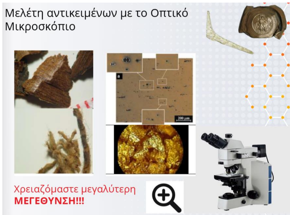
Εικόνα 2. Απόσπασμα αναφοράς μαθητών/τριών – Οπτικό Μικροσκόπιο