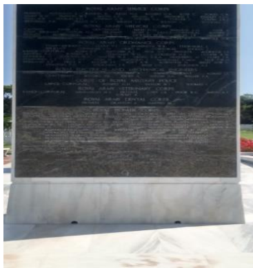
Εικόνα 1: Οι μαρμάρινες επιτύμβιες πλάκες είναι τοποθετημένες στην είσοδο του Συμμαχικού Νεκροταφείου

Τα επιλεγμένα σημεία επίσκεψης της γεωδιαδρομής (Εικόνα 1) είναι τοποθεσίες με ποικιλία δομικών υλικών (μάρμαρο Πεντέλης/Θάσου/Νάξου, μάρμαρο με ρουδιστές, ασβεστόλιθο, γρανίτη), είναι κοντά σε έντονο γεωλογικό ανάγλυφο: στον Υμηττό, στο Ρέμα Πικροδάφνης, στις εκβολές του ρέματος, σε ακροθαλασσιά και συνδυάζουν τους εκπαιδευτικούς μας στόχους. Οι μαθήτριες/τες χρησιμοποιούν δεξιότητες πεδίου.