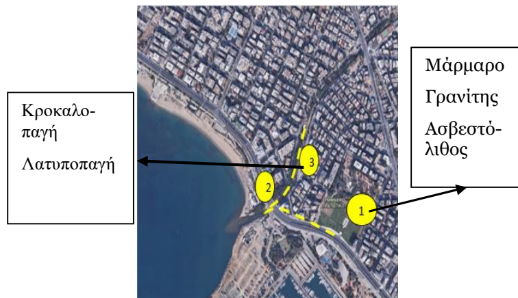
Εικόνα 2: Η επιλεγμένη διαδρομή: