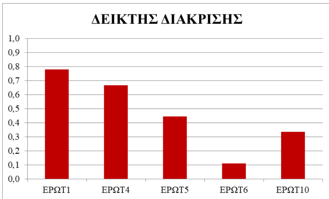
Σχήμα 3. Γράφημα με το δείκτη διάκρισης των ερωτήσεων του ερωτηματολογίου που δόθηκε στους μαθητές

Από την περαιτέρω στατιστική ανάλυση που πραγματοποιήθηκε, διαφαίνεται ότι υπάρχει ισχυρή συσχέτιση μεταξύ της χαμηλής επίδοσης στο μάθημα της Φυσικής και του χαμηλού επιπέδου γνώσης των ιστορικών στοιχείων. Για αυτόν τον λόγο, χρησιμοποιήθηκε ο Συντελεστής Συσχέτισης Pearson (Pearson's correlation coefficient), ο οποίος μετρά τη γραμμική σχέση μεταξύ δύο μεταβλητών. Η τιμή του συντελεστή κυμαίνεται από -1 έως 1 , με το 0 να υποδηλώνει έλλειψη συσχέτισης και το 1 ή -1 να υποδηλώνει τέλεια θετική ή αρνητική συσχέτιση, αντίστοιχα.