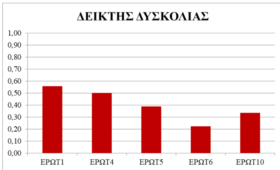
Σχήμα 2. Γράφημα με το δείκτη δυσκολίας των ερωτήσεων του ερωτηματολογίου που δόθηκε στους μαθητές

Όσον αφορά τον Δείκτη Διάκρισης (discrimination index), αυτός μετρά την ικανότητα ενός ερωτήματος να διαχωρίζει ομάδες με διαφορετικά χαρακτηριστικά. Υψηλές τιμές Δείκτη Διάκρισης ( > 0.4 ) υποδεικνύουν ότι