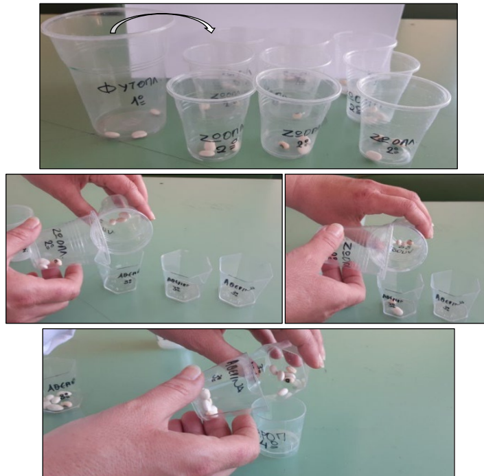
Σχήμα 3. Προσομοίωση της ροής ενέργειας στο υποθετικό οικοσύστημα της 2 ης δραστηριότητας.

Κατόπιν, η κάθε ομάδα υπολογίζει, μετρώντας τον αριθμό των μαυρομάτικων φασολιών που έχουν καταλήξει σε κάθε ποτηράκι, την ποσότητα του DDT που καταλήγει σε κάθε θηρευτή κάθε τροφικού επιπέδου. Η όλη διαδικασία επαναλαμβάνεται τρεις φορές (1 η , 2 η , 3 η δοκιμή) και υπολογίζεται ο μέσος όρος της ποσότητας του ρύπου ανά άτομο, ώστε να διαπιστωθεί η αύξηση του ρύπου στους οργανισμούς των ανώτερων τροφικών επιπέδων. Οι μαθητές/τριες συμπληρώνουν το Φ.Ε. (Σχήμα 4) και συζητούν για τους περιορισμούς και τις παραδοχές του μοντέλου και του σχολικού εγχειριδίου.