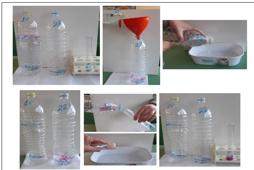
Σχήμα 5. Προσομοίωση της ροής ενέργειας στο υποθετικό οικοσύστημα της 3 ης δραστηριότητας.

Οι μαθητές/τριες υπολογίζουν τις συγκεντρώσεις του ρύπου στο 1 ο και στο 2 ο τροφικό επίπεδο, βάσει του όγκου του νερού και του αριθμού των κομματιών πλαστικού που παραμένουν σε κάθε "μπουκάλι". Με ανάλογο τρόπο προσομοιώνεται η ροή ενέργειας και μεταξύ των υπόλοιπων τροφικών επιπέδων και υπολογίζονται οι αντίστοιχες συγκεντρώσεις του ρύπου για να διαπιστωθεί η κατά 10% αύξηση της συγκέντρωσής του από το ένα επίπεδο στο αμέσως επόμενο. Η κάθε ομάδα συμπληρώνει το Φ.Ε. (Σχήμα 6) και οι μαθητές/τριες συζητούν τους λόγους για τους οποίους δεν μεταφέρθηκε όλη η ποσότητα του νερού από το κάθε μπουκάλι στο επόμενο, τους λόγους για τους οποίους χάνεται το 90% της βιομάζας κάθε επιπέδου,