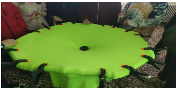
Εικόνα 1: ο προσομοιωτής του χωροχρόνου

Ως διδακτική τεχνική επιλέχθηκε η διδασκαλία με τη βοήθεια του μοντέλου του προσομοιωτή του χωροχρόνου (Kaur et al., 2017 · Forpoli et al., 2019). Κατά το μοντέλο αυτό, ο χωροχρόνος αναπαρίσταται από ένα ελαστικό ‘σεντόνι’ πάνω στο οποίο τοποθετούνται σώματα διαφορετικών μαζών με στόχο οι μαθητές/τριες να παρατηρήσουν τις κινήσεις τους.