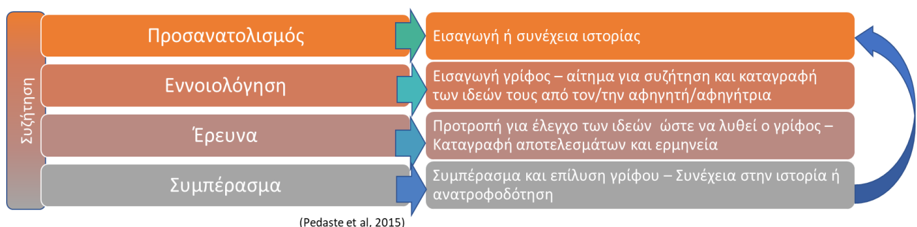
Σχήμα 1. Η σύνδεση της δομής των ARG με τις φάσεις της Διερεύνησης στη προσέγγιση IB-ARGI

Όπως φαίνεται από το Σχήμα 1, οι εκπαιδευόμενοι εισάγονται μέσω μια πολυτροπικής αφήγησης (σε περιβάλλον επαυξημένης πραγματικότητας) σε μια ιστορία που καταλήγει στην αντιμετώπιση ενός προβλήματος (Προσανατολισμός). Η ιστορία αυτή καταλήγει στη διατύπωση ενός γρίφου προς επίλυση και καλεί τις εκπαιδευόμενες να εκφράσουν και να καταγράψουν τις απόψεις τους (Εννοιολόγηση). Έπειτα, ο