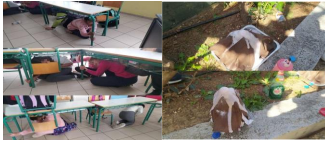
Εικόνα 2: Δράσεις από το 5 ο & 6 ο εργαστήριο

Στο 7 ο εργαστήριο, πραγματοποιείται η αξιολόγηση του εργαστηρίου, των εκπαιδευτικών αλλά και αυτοαξιολόγηση των μαθητών/τριών μέσα από σχετικό ερωτηματολόγιο. Τέλος, δημιουργούν σχετική αφίσα ενημέρωσης που κοινοποιείται σε όλα τα μέλη της σχολικής κοινότητας στο πλαίσιο ανάπτυξης πολιτικών και κοινωνικών δεξιοτήτων και πολιτειότητας. Η αξιολόγηση των εργαστηρίων ήταν διαμορφωτική, διαρκής και δυναμική. Σκοπός ήταν κάθε φορά να επιτυγχάνονται οι στόχοι του κάθε εργαστηρίου μέσα από τις πολυεπίπεδες δραστηριότητες, δηλαδή η ενίσχυση των δεξιοτήτων των παιδιών και φυσικά να διασκεδάσουν και να αποφορτιστούν από τις υποχρεώσεις της ημέρας. Στο τέλος, ειδικά, του εργαστηρίου, η διαδικασία της αξιολόγησης είχε χαρακτήρα αναστοχαστικό για κάθε συμμετέχοντα/ουσα για το τι και πώς έμαθε, τι του χρειάζεται στη ζωή του και αν θα το χρησιμοποιήσει και ποιες δεξιότητες θεωρεί ότι ανέπτυξε και βεβαίως τι αλλαγές βελτιωτικές ή μετατόπιση συμπεριφορών χρειάζεται να γίνουν.