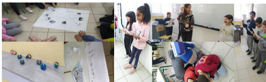
Εικόνα 1: Δράσεις από τα 4 πρώτα εργαστήρια

Στο 3 ο εργαστήριο, οι μαθητές/τριες μαθαίνουν μύθους διάφορων λαών ανά τον κόσμο για το σεισμό από το βιβλίο «Η γη χορεύει – Μύθοι και αλήθειες για το σεισμό από όλο τον κόσμο». Στη συνέχεια σε ομάδες αναλαμβάνουν να αναπαραστήσουν μέσα από θεατρικό δράσιμο ή παρουσίαση το μύθο που διαπραγματεύτηκαν. Τέλος, προβάλλεται βίντεο για τον ελληνικό μύθο του Εγκέλαδου και προκαλείται σχετική συζήτηση εντοπίζοντας διαφορές ή ομοιότητες με τους άλλους μύθους. Εδώ οι μαθητές/τριες έγινε προσπάθεια να προάγουν την εσυναίσθηση και το σεβασμό για άλλους λαούς με παράλληλη στόχευση στη δημιουργικότητα και συνεργασία μέσω τέχνης, την ανάληψη πρωτοβουλιών επί των εκφραστικών εκδηλώσεων και ακόμη την ενίσχυση της επιχειρηματολογίας και του διαλόγου κατά τη συζήτηση για τους μύθους.