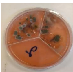
Εικόνα 2 Καλλιέργειες μικροβίων

Τέλος, συνδέουν τους μικροοργανισμούς με τη διαδικασία της παστερίωσης μέσω της παρατήρησης στο μικροσκόπιο δείγματος φρέσκου και αλλοιωμένου παστεριωμένου γάλακτος.